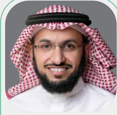
متحدث أ. عبدالعزيز بن سعود الدحيم وكيل وزارة التجارة للشؤون القانونية