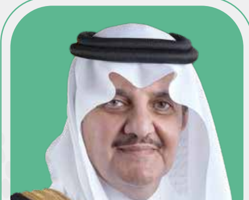
سمو أمير المنطقة الشرقية سعود بن نايف بن عبدالعزيز