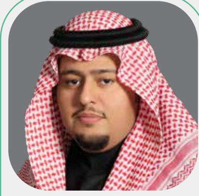
متحدث أ. بدر النجيم وكيل هيئة السوق المالية للشؤون القانونية والتنفيذ